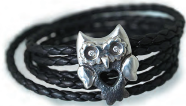
Eksempler på kursisters arbejde.