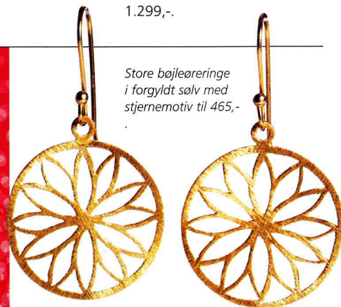
Store bøjleøreringe i forgyldt sølv med stjernemotiv til 465,-