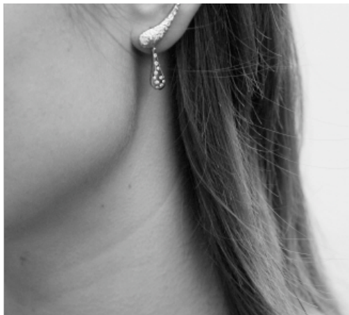
De dråbeformede øresmykker til Kronprinsesse Mary er udført i 14 karat rustik rødguld og blankt hvidguld og dekoreret med små brillanter.