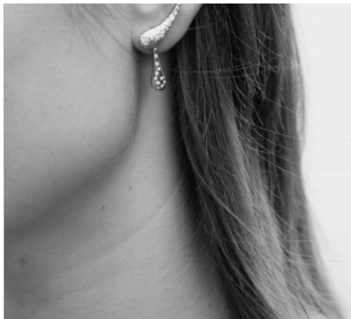
De dråbeformede øresmykker til Kronprinsesse Mary er udført i 14 karat rustik rødguld og blankt hvidguld og dekoreret med små brillanter.